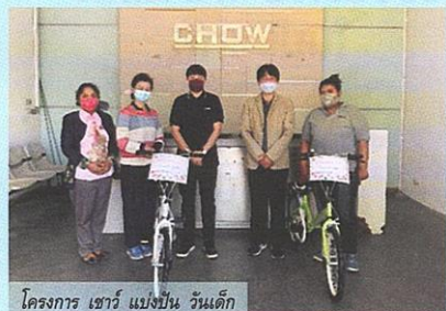
โครงการ เซอร์ แบ่งปัน วันเด็ก

อีกทั้ง บริษัทได้ตระหนักถึงความสำคัญในการประกอบธุรกิจ โดยคำนึงถึงหลักการดำเนินธุรกิจภายใต้การกำกับดูแลองค์กรที่ดีโดยดำเนินงานด้วยสำนึกความรับผิดชอบต่อผลกระทบในด้านต่างๆ ทั้งสิ่งแวดล้อมและชุมชน และได้ยึดหลักการดำเนินธุรกิจอย่างมีจริยธรรม โปร่งใส ตรวจสอบได้ เคารพต่อหลักสิทธิมนุษยชน ปฏิบัติตามข้อกำหนดของกฎหมาย ยึดต่อแนวปฏิบัติสากล โดยคำนึงถึงผลประโยชน์ของผู้มีส่วนได้เสีย รวมทั้งจะมุ่งมั่นพัฒนาปรับปรุง เพื่อสร้างรากฐานของความรับผิดชอบ