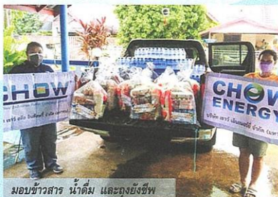
มอบข้าวสาร น้ำดื่ม และถุงยังชีพ