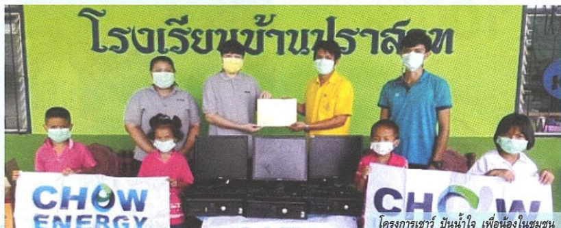
โครงการเชอร์ บันน้ำใจ เพื่อน้องในชุมชน

ล่าสุด บริษัท เซอร์ สตีล อินดัสทรี จำกัด (มหาชน) รับรางวัลองค์กรโปร่งใส และบริษัท เซอร์ เอ็นเนอร์ยี จำกัด (มหาชน) รับรางวัลชมเชยองค์กรโปร่งใส ครั้งที่ 10 (NACC Integrity Awards) จากสำนักงานเมืองกินและปราบปรามการทุจริตแห่งชาติ (สำนักงาน ป.ป.ช.) โดยที่ผ่านมาก เซอร์ ได้รับรางวัลชมเชยองค์กรโปร่งใส สะท้อนถึงการเป็นองค์กรที่บริหารจัดการด้วยหลักธรรมาภิบาลอย่างต่อเนื่อง โปร่งใส ตรวจสอบได้