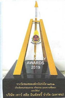
รางวัลชมเชยองค์กรโปร่งใส ๒๕๖๓ บริษัทเซตองอุตสาหกรรม จีเอ็มเอ็ม และรวมซีเอสเอ และอีทีอี บริษัท เซอร์ สตีล อินดัสทรี จำกัด (มหาชน)