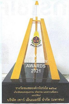
รางวัลชมเชยองค์กรโปร่งใส ๒๕๖๔ บริษัทเซตองอุตสาหกรรม จีเอ็มเอ็ม และรวมซีเอสเอ และอีทีอี บริษัท เซอร์ สตีล อินดัสทรี จำกัด (มหาชน)