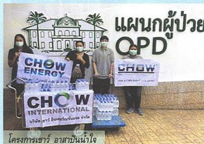
โครงการเชอร์ อาสาปันน้ำใจ